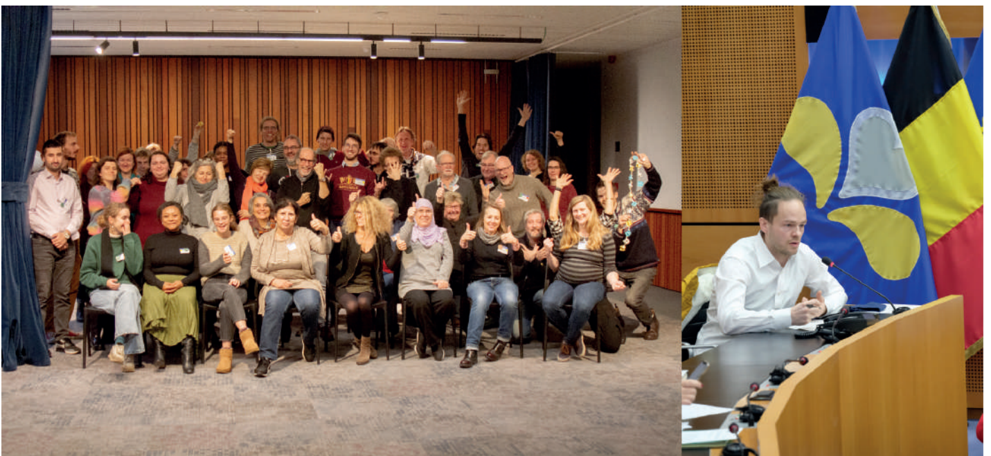
Photo 2 : Gauche : participant.e.s à la quatrième assemblée citoyenne bruxelloise organisée par Agora.brussels. Droite : intervention de Pepijn Kennis (élu d'Agora) au Parlement Bruxellois.

Ce mouvement citoyen s'est présenté aux élections régionales bruxelloises de 2019 avec un objectif unique : organiser des assemblées citoyennes pour en porter le résultat le plus littéralement possible au parlement 6 .